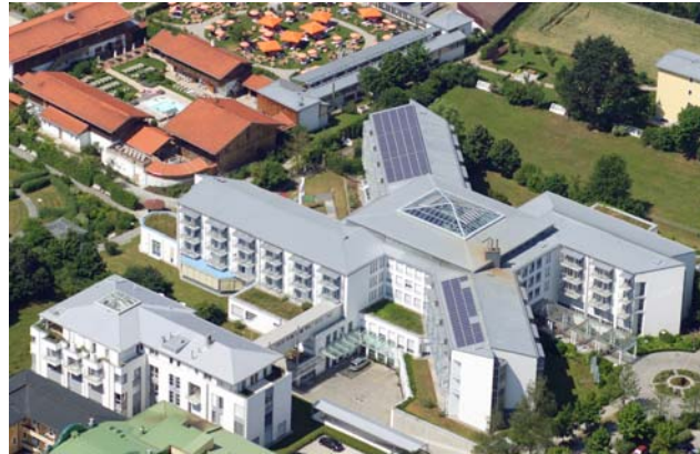
Orthopädie-Zentrum Bad Füssing